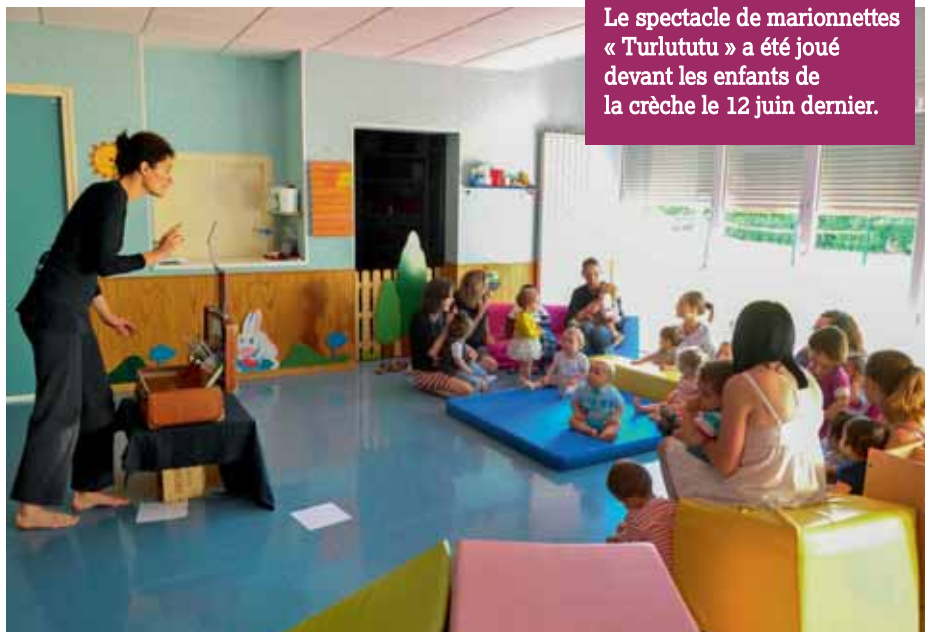
TURLUTUTU Le spectacle de marionnettes « Turlututu » a été joué devant les enfants de la crèche le 12 juin dernier.

Retrouvez toute la programmation sur www.ville-tineux.fr