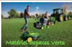
Matériel Espaces Verts